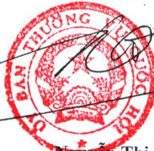
Nguyễn Thị Kim Ngân